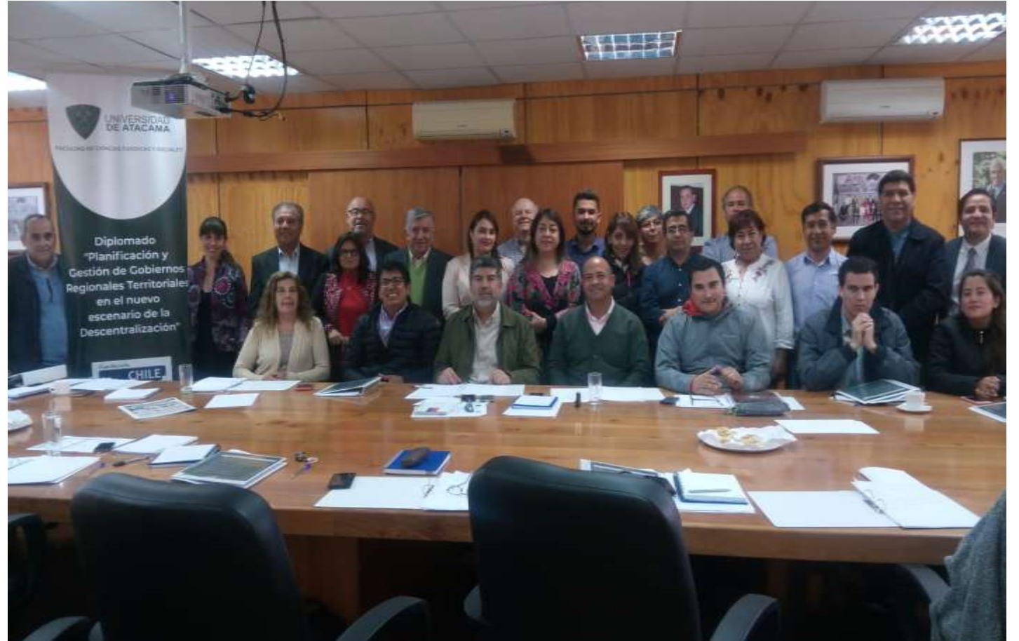
Foto: Diplomado CORE. Diciembre 2018.